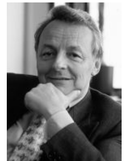
Laurent Van Depoele

Voor deelname dient te worden ingeschreven vòòr vrijdagavond 5 oktober 2018 via :